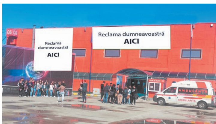
AFISARE BANNERE PE FATADA PAVILIONULUI C6