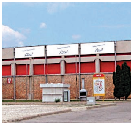
AFISARE BANNERE PE FATADA PAVILIONULUI C5