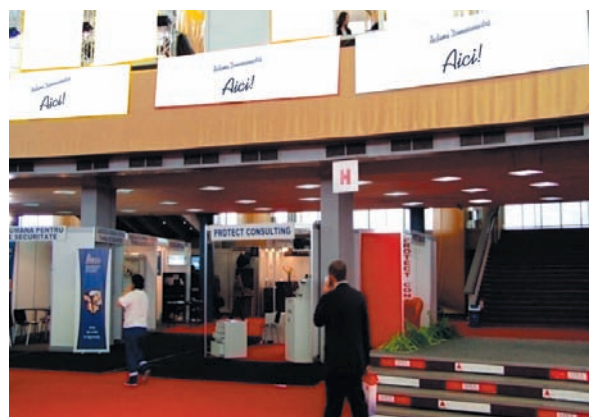
AFISARE BANNERE PAVILION A, FRIZA 4.50