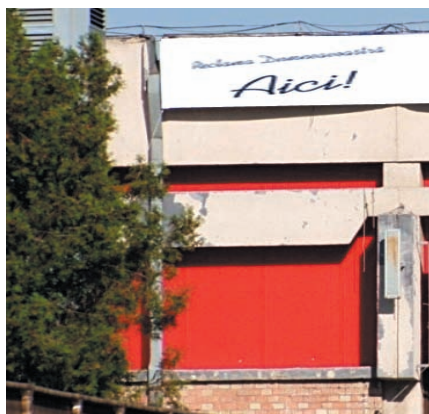
AFISARE BANNERE PE FATADA PAVILIONULUI C4