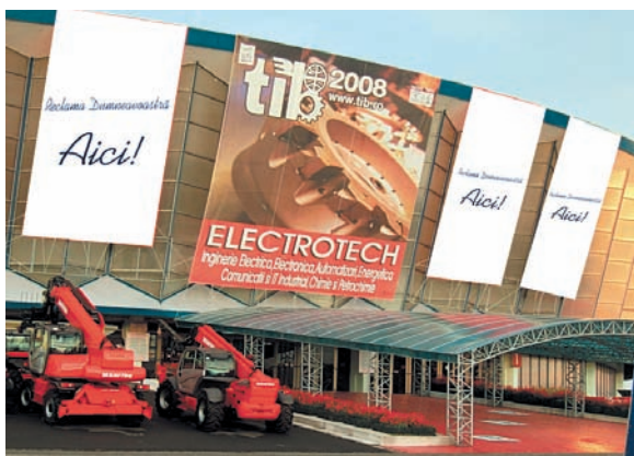
AFISARE BANNERE PE FATADA PAVILIONULUI A