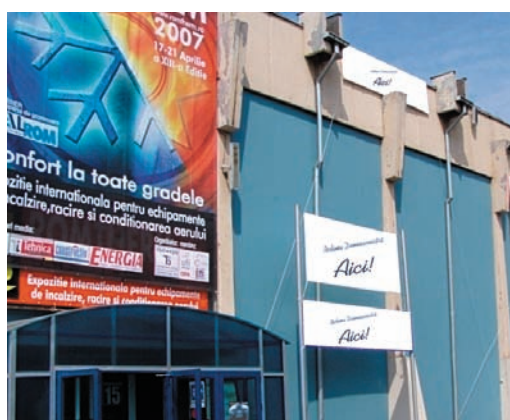
AFISARE BANNERE PE FATADA PAVILIONULUI C1